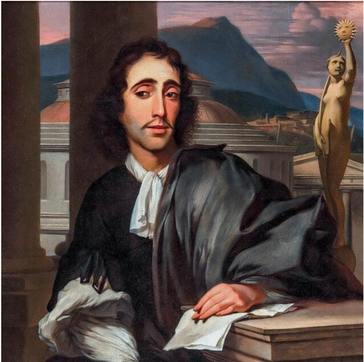
Olieverfschilderij door Barend Graat (1666)